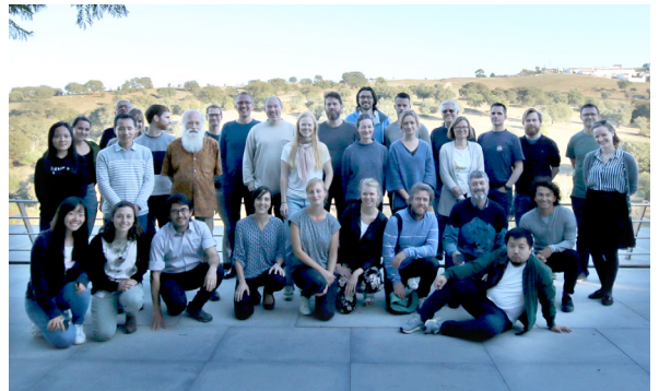
Det årlige forskningsretreat fandt sted i regionen Arraiolos i Portugal. Alle ph.d.-studerende og post Docs deltog sammen med centerlederen og seniorforskere i workshops og brainstorming om CMEC's forskningsprogram.

Senior- og juniorforskere fra CMEC modtog to priser og 21 bevillinger i 2017.