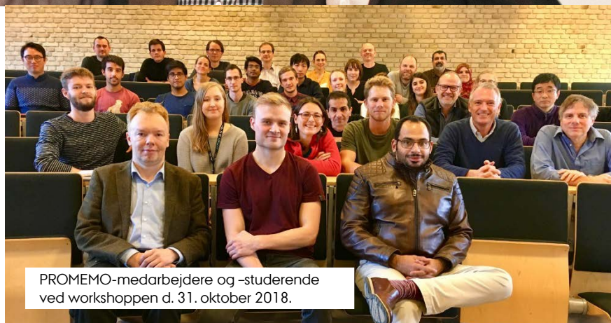
PROMEMO-medarbejdere og -studerende ved workshopen d. 31. oktober 2018.

Den 31. oktober var alle PROMEMO-affilierede medarbejdere og studerende samlet til en dag med videnskabelige præsentationer og networking. Workshopen gav rig lejlighed til at diskutere PROMEMO-projekter, udfordringer, samarbejder, nye idéer, metoder og teknikker – samt til socialt samvær. Lignende workshops vil blive arrangeret hvert kvartal.