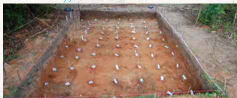
Næsten usynlige spor af et hus fra middelalderen på Zanzibar (Menai Bugt) blev påvist ved hjælp af ny multi-skala og statistisk tilgang.