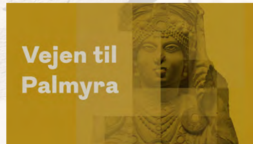
Udstillingen 'Vejen til Palmyra'.