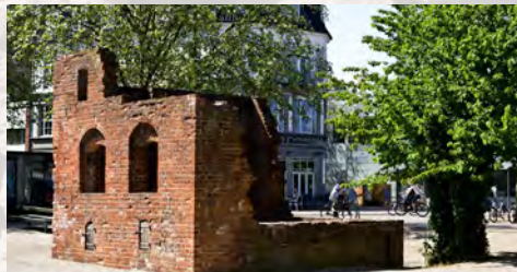
Resterne af et handelshus i Odense, Danmark, fra det 15. århundrede.