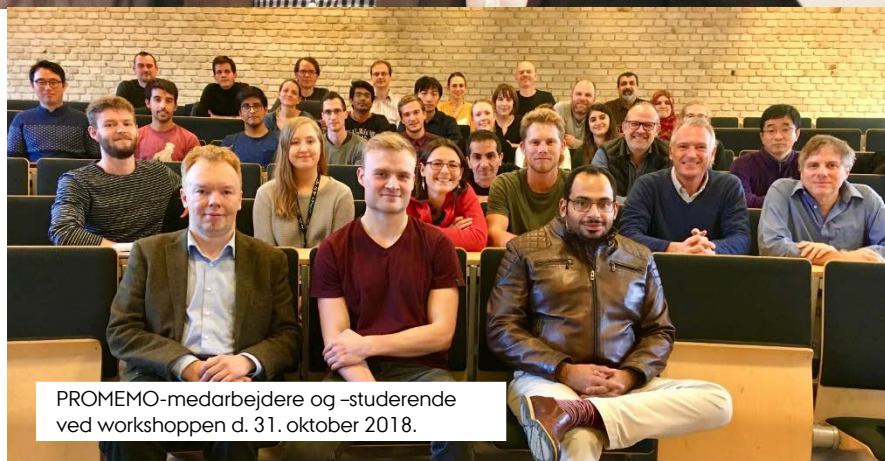
PROMEMO-medarbejdere og -studerende ved workshoppen d. 31. oktober 2018.

Den 31. oktober var alle PROMEMO-affilierede medarbejdere og studerende samlet til en dag med videnskabelige præsentationer og networking. Workshoppen gav rig lejlighed til at diskutere PROMEMO-projekter, udfordringer, samarbejder, nye idéer, metoder og teknikker – samt til socialt samvær. Lignende workshops vil blive arrangeret hvert kvartal.