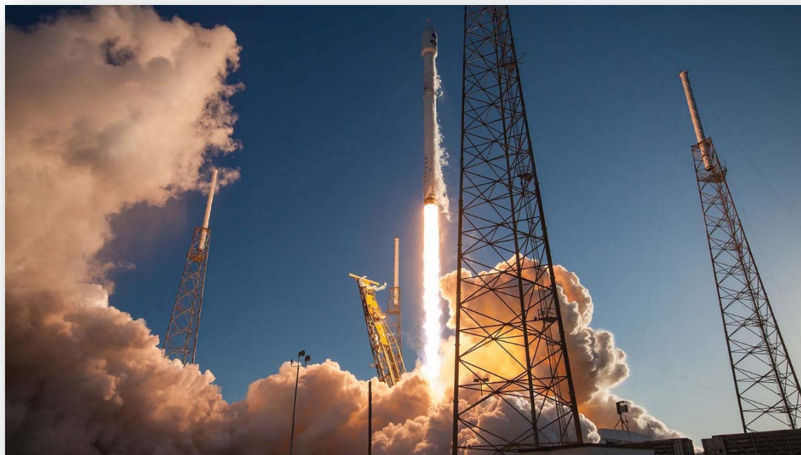
Opsendelsen af TESS med en Falcon 9 fra Kennedy Space Center i april 2018.